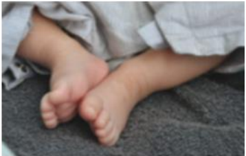
Former à l'accompagnement du lien mère-enfant en situation difficile