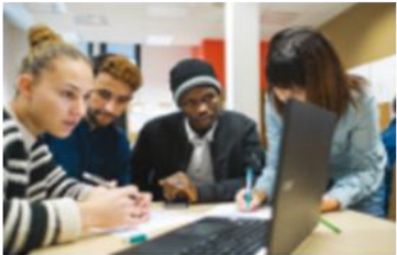
Former les migrants aux compétences inclusives