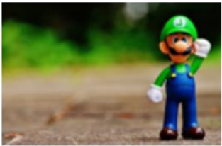
Un jeu vidéo sur le développement durable par les élèves de Seine St Denis, d'Italie et de Roumanie